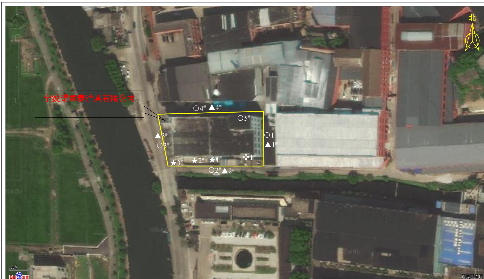
图 3-1 验收监测点位示意图